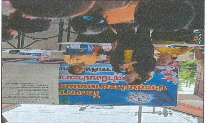
កម្មវិធីបណ្តុះបណ្តាលសម្រាប់បេក្ខជនសម្រាប់ការបោះឆ្នោតសម្រាប់ប្រជាជន រៀបចំដោយគម្រោងការងារសម្រាប់បេក្ខជនសម្រាប់ការបោះឆ្នោតសម្រាប់ប្រជាជន

កម្មវិធីបណ្តុះបណ្តាលសម្រាប់បេក្ខជនសម្រាប់ការបោះឆ្នោតសម្រាប់ប្រជាជន ដែលមានប្រជាជនចូលរួមចំនួន ២០០នាក់ ក្នុងមួយថ្ងៃ ក្នុងមួយខែ ក្នុងមួយឆ្នាំ ក្នុងមួយស្ថានភាព/ទូរស័ព្ទ ១០០ ដែលមានប្រជាជនចូលរួមចំនួន ២០០នាក់ ក្នុងមួយថ្ងៃ ក្នុងមួយខែ ក្នុងមួយឆ្នាំ ក្នុងមួយស្ថានភាព/ទូរស័ព្ទ ១០០