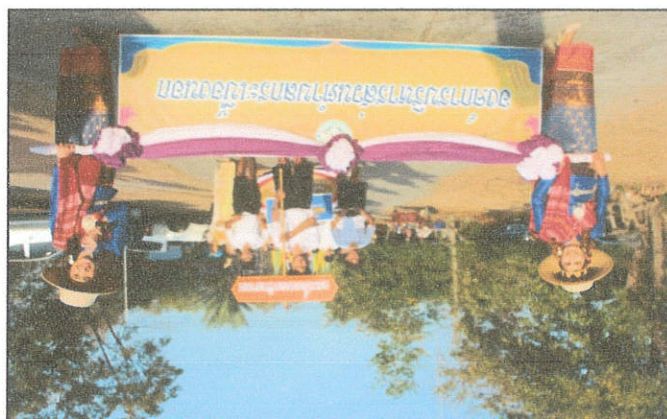
ប្រទេស ប្រទេស ប្រទេស ប្រទេស ប្រទេស ប្រទេស ប្រទេស ប្រទេស ប្រទេស ប្រទេស

ឧបត្ថម្ភសេដ្ឋកិច្ច និងហិរញ្ញវត្ថុ រាជរដ្ឋាភិបាលកម្ពុជា