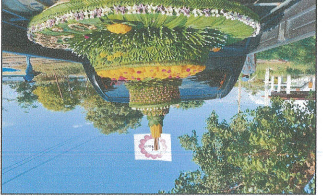
បទដ្ឋាន ប្រឡូកស្រី ឆ្នាំ ២០១៧ ក្រុងស្រីរាជធានីភ្នំពេញ ក្រុងស្រីរាជធានីភ្នំពេញ