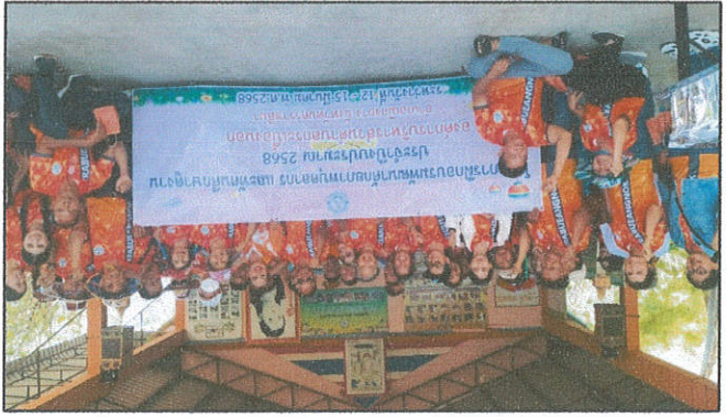
កម្មវិធីបណ្តុះបណ្តាលសម្រាប់បេក្ខជនសម្រាប់ការបោះឆ្នោតសម្រាប់ប្រជាជន រៀបចំដោយគម្រោងការងារសម្រាប់បេក្ខជនសម្រាប់ការបោះឆ្នោតសម្រាប់ប្រជាជន

កម្មវិធីបណ្តុះបណ្តាលសម្រាប់បេក្ខជនសម្រាប់ការបោះឆ្នោតសម្រាប់ប្រជាជន ដែលមានប្រជាជនចូលរួមចំនួន ២០០នាក់ ក្នុងមួយថ្ងៃ ក្នុងមួយខែ ក្នុងមួយឆ្នាំ ក្នុងមួយស្ថានភាព/ទូរស័ព្ទ ១០០ ដែលមានប្រជាជនចូលរួមចំនួន ២០០នាក់ ក្នុងមួយថ្ងៃ ក្នុងមួយខែ ក្នុងមួយឆ្នាំ ក្នុងមួយស្ថានភាព/ទូរស័ព្ទ ១០០