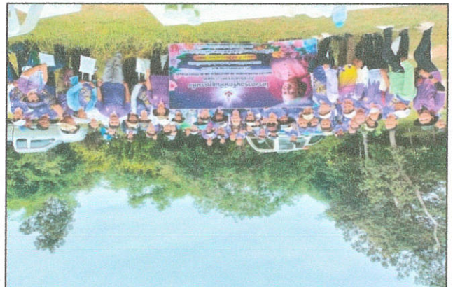
(១២៧០) ប្រជាជនក្នុងតំបន់ភ្នំពេញដែលមានប្រជាជនរស់នៅក្នុងតំបន់ភ្នំពេញដែលមានប្រជាជនរស់នៅក្នុងតំបន់ភ្នំពេញ