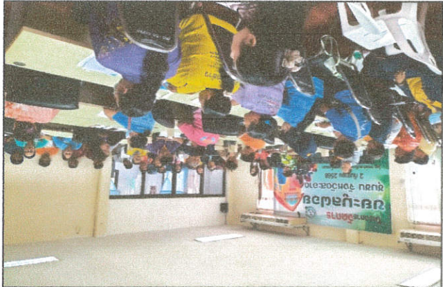
រូបថតនៃបទល្មើសព្រហ្មទណ្ឌ(១)

កិច្ចការនៃការរំលោភបំពានសិទ្ធិរបស់ស្ត្រីស្រីដែលរងគ្រោះពីជំនឿសាសនា/ទូរស័ព្ទលេខ ១១៥